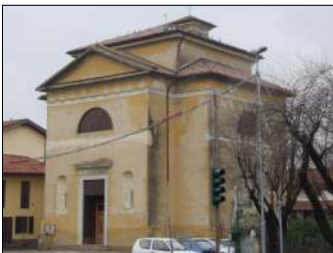
Chiesa Monzoro – Prima dell'intervento