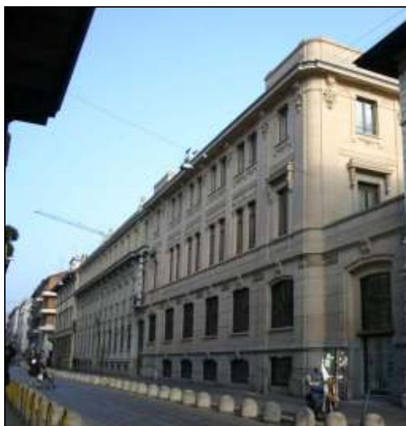
Via Solferino, 28 – Milano