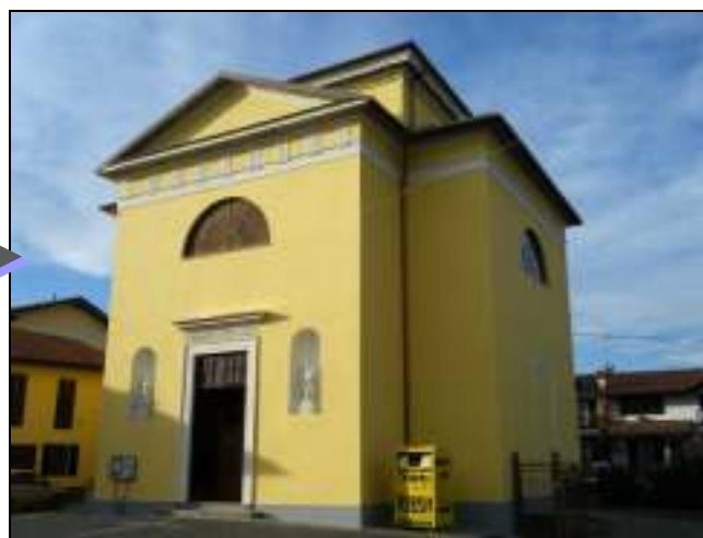
Chiesa Monzoro – Dopo l'intervento