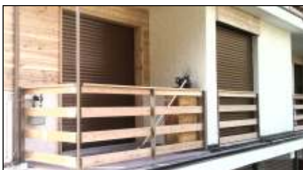
Alagna – Nuovi parapetti e rivestimenti in larice