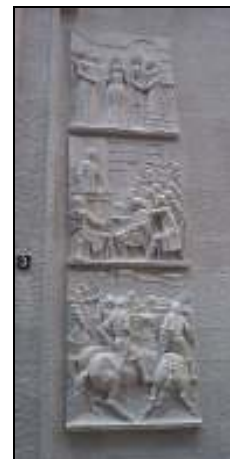
Banca Nazionale del Lavoro, P.zza San Fedele, Milano