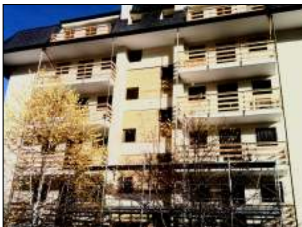
Alagna – Restyling completo