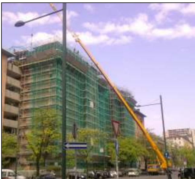
Via Monte Rosa, Milano – Rifacimento coperture