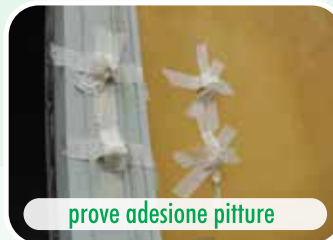
prove adesione pitture