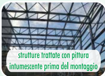
strutture trattate con pittura intumescente prima del montaggio