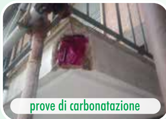
prove di carbonatazione