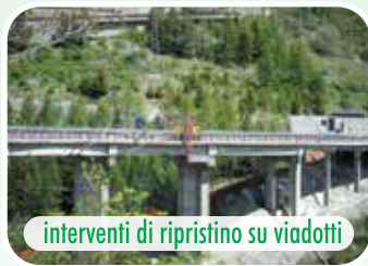
interventi di ripristino su viadotti