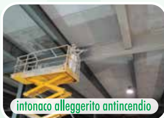
intonaco alleggerito antincendio