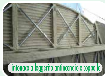
intonaco alleggerito antincendio e coppelle