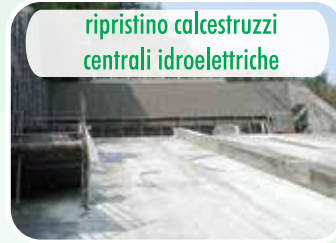
ripristino calcestruzzi centrali idroelettriche