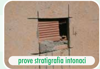
prove stratigrafia intonaci