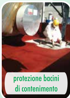
protezione bacini di contenimento