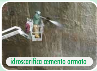
idroscarifica cemento armato