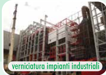
verniciatura impianti industriali