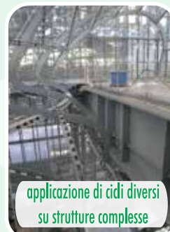
applicazione di cidi diversi su strutture complesse