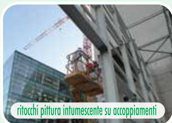
ritocchi pittura intumescente su accoppiamenti