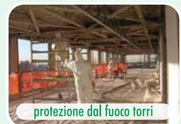
protezione dal fuoco torri