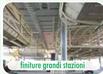
finiture grandi stazioni