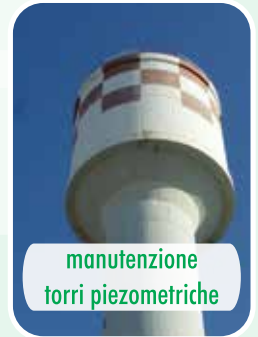
manutenzione torri piezometriche