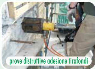
prove distruttive adesione tirafondi