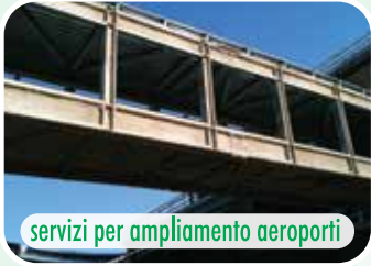
servizi per ampliamento aeroporti