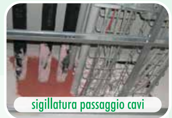
sigillatura passaggio cavi