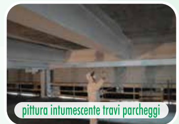
pittura intumescente travi parcheggi