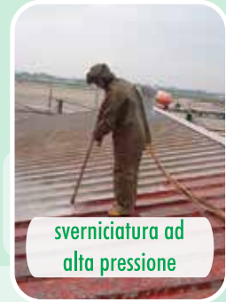
sverniciatura ad alta pressione