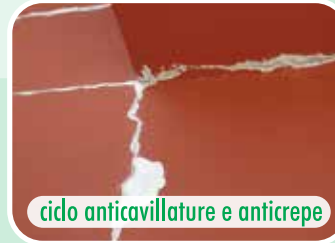
ciclo anticavillature e anticrepe