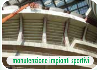
manutenzione impianti sportivi