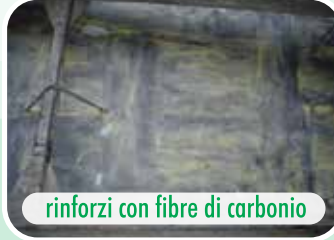
rinforzi con fibre di carbonio