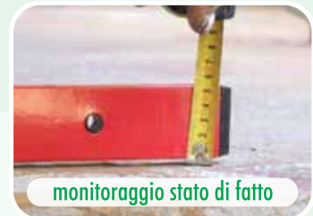
monitoraggio stato di fatto