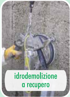
idrodemolizione a recupero