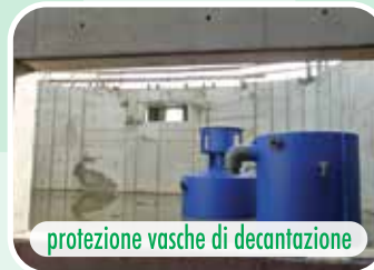
protezione vasche di decantazione