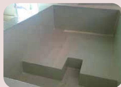
ripristino vasche per uso alimentare e non