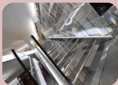
restyling punti vendita