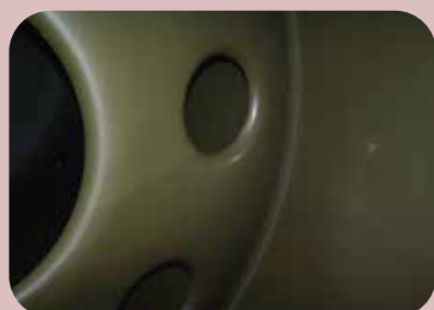
isovetrificazione serbatoi per trasporto e stoccaggio