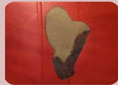
analisi problematiche (manutenzione, correnti vaganti)