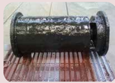
ripristino di superfici con rivestimenti antiabrasivi