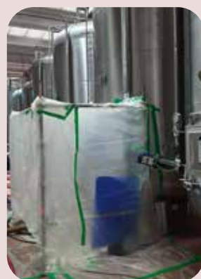
interventi mirati con altri serbatoi operativi