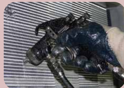
protezione scambiatori con cicli resistenti a batteri e funghi