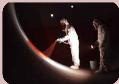
lining interno autoclavi con sistemi per uso alimentare