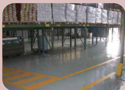
segnaletica di sicurezza