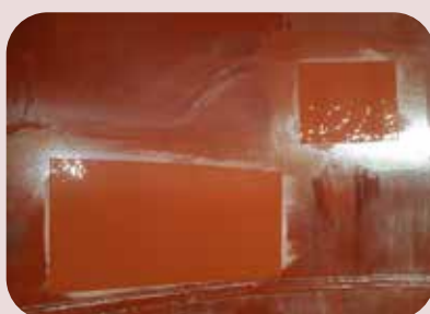
ispezioni e ripristini su rivestimenti interni