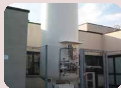
manutenzione serbatoi gas tecnici