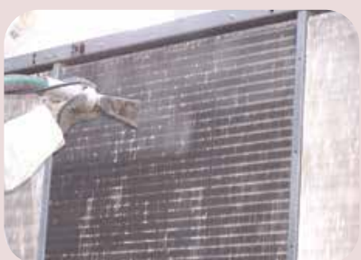
manutenzione impianti di condizionamento