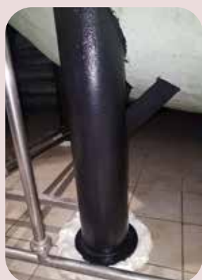
ispezioni e ripristini su rivestimenti esterni