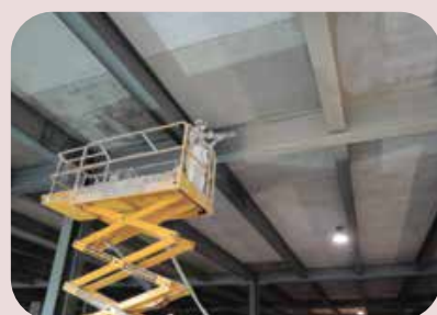
interventi protezione dal fuoco