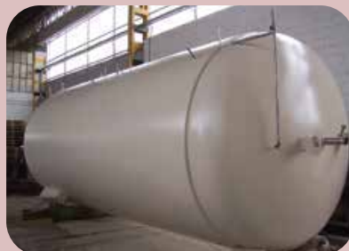
rivestimento esterno serbatoi