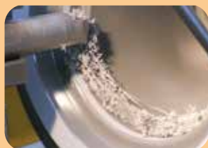
rivestimento rilavorabili a macchina