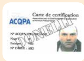
35 applicatori ACQPA