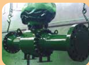
rivestimenti epossidici per valvole subsea