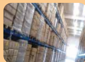
Stoccaggio e servizi doganali

Packaging in collaborazione con Tecno Imballi, disponibile brochure dedicata.