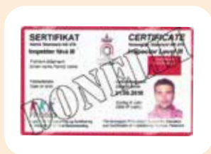
6 ispettori FROSIO