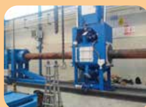
gestione impianti di verniciatura presso clienti