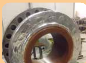
rivestimenti epossifenolici per alte temperature