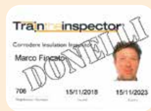
1 ispettore CORRODERE