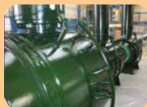
rivestimenti epossidici/poliuretanic per valvole interrate