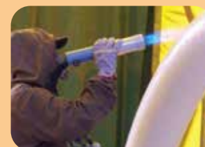
sistemi FBE + PP e PE applicato per flame spray