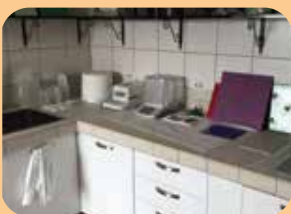
test di laboratorio