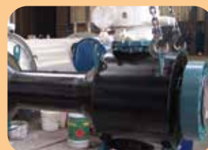
rivestimenti poliuretanic per valvole deep sea