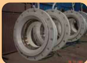
rivestimenti per uso alimentare