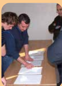
formazione tecnica e pubblicazioni