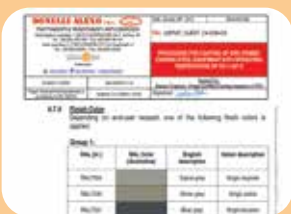
preparazione di specifiche di verniciatura