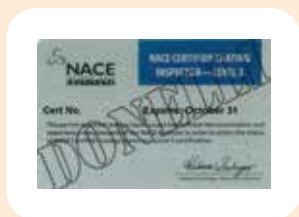
12 ispettori NACE