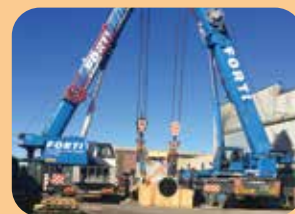
movimentazione pezzi pesanti fino a 150 ton.