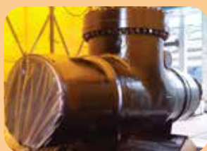
rivestimenti poliuretanic per valvole interrate