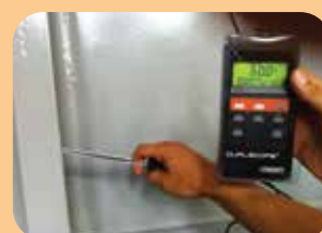
ispezioni e collaudi con ispettori NACE / FROSIO / CORRODERE