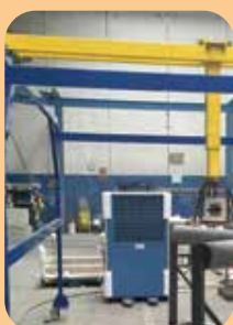
progetti congiunti di ricerca e sviluppo