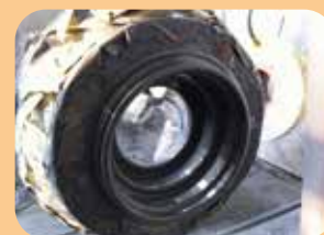
FBE (Fusion Bonded Epoxy)